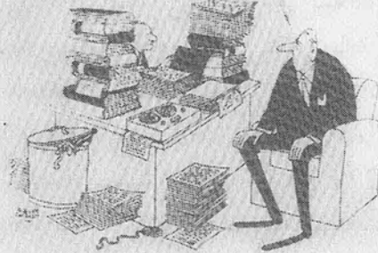
صورة كاريكاتورية تمثل الجنرال دوغول أمام القاضي زولينجر